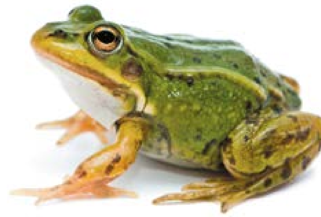
○ żaba śmieszka